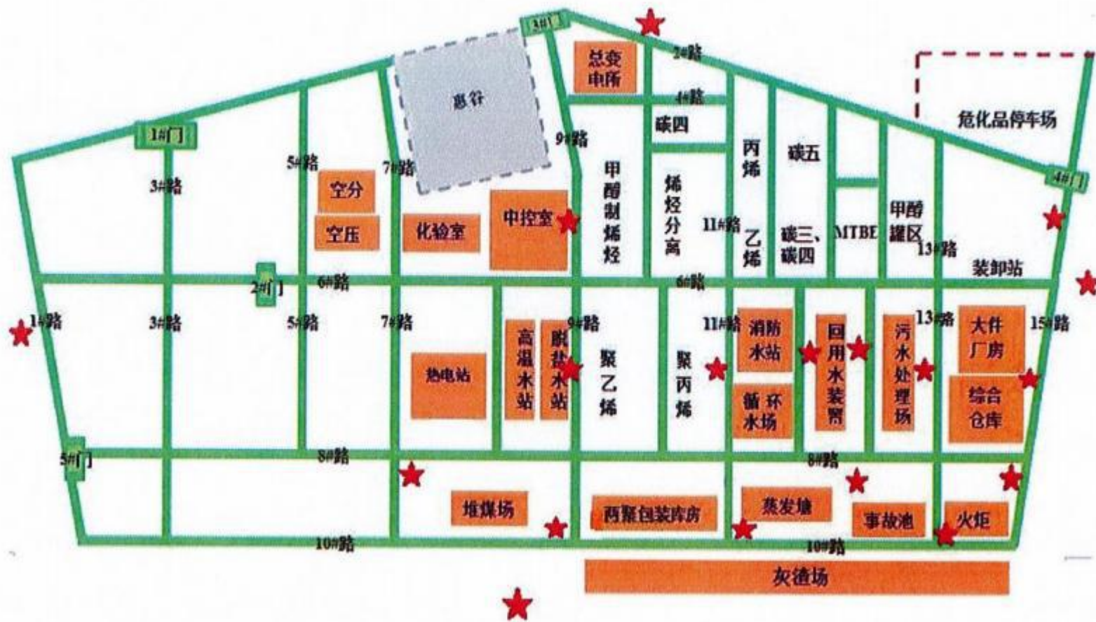
土壤检测点位示意图